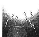
אין שום חשיבות לנסיבות ההתעברות