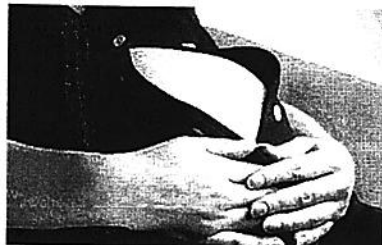
האם הבטן הזו היא תוצאה של מצג שווא?

המישור היחיד בו טענה כזאת יכולה לעלות היא במישור הנזיקי או במישור החוזי. מכוח עקרונות דיני הנזיקין, השוללים מצג שווא או מצג כוזב, וכן מכוח עקרונות תום הלב והדרך המקובלת על פי חוק החוזים (חלק כללי) התשל"ג-1973, יכול גבר לטעון כי על האשה היה לתת גילוי מלא ולפעול בהיעדר זדון.