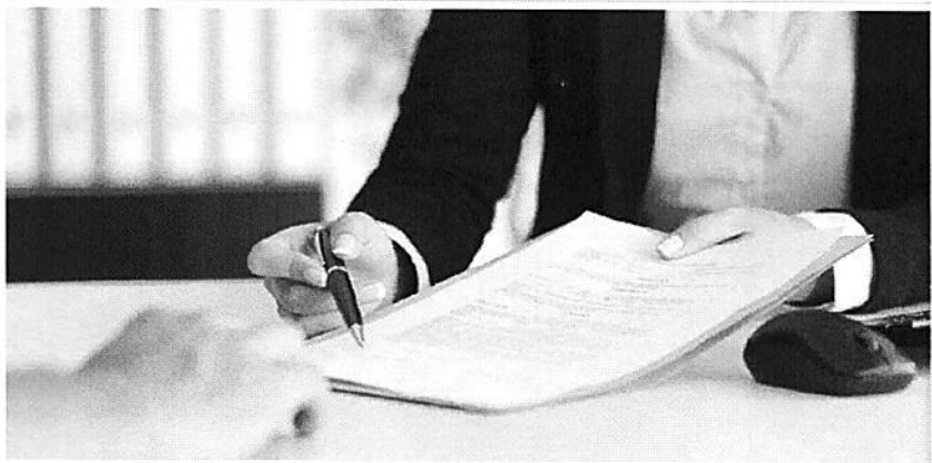
ניסוח לחמש ולהעביר רגלש מצוואה הודית