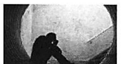
תבע לבטל הסכם נירושים: "סבלתי מפוסט-טראומה בעקבות פיגוע"