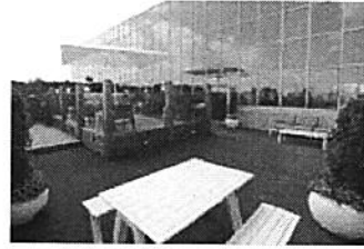
איפה יפגשו השבוע מאות יזמים חרדים?

ואולם, השלושה נתקלו בסירובו העיקש והנחרץ של האב, שלטענתו חידוש הקשר יפגע בבנו הרגיש פגיעה חמורה וקשה.