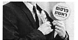
"יותר מ-70 מיליון": האחים מאלעד והעוקץ