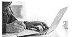
לנשים: הכשרה מקצועית לניהול ושיווק (פרסומי)