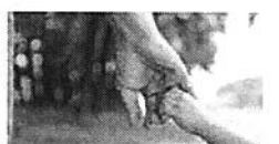
שופט קרא לאב "להפנים שיש לו בת" ודחה את ערעורו על מזונות זמניים