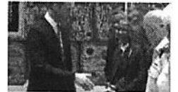
כשהרל"שית החרדית סירבה ללחוץ יד לנסיך