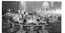
הנושה של הדר-דימול מנסה להציל את כספו