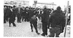
בעקבות 'כיכר השבת': בוטלה הרשעת מפגין