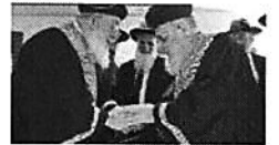
ידידות אמיצה: נאום השבחים של הגר"ש